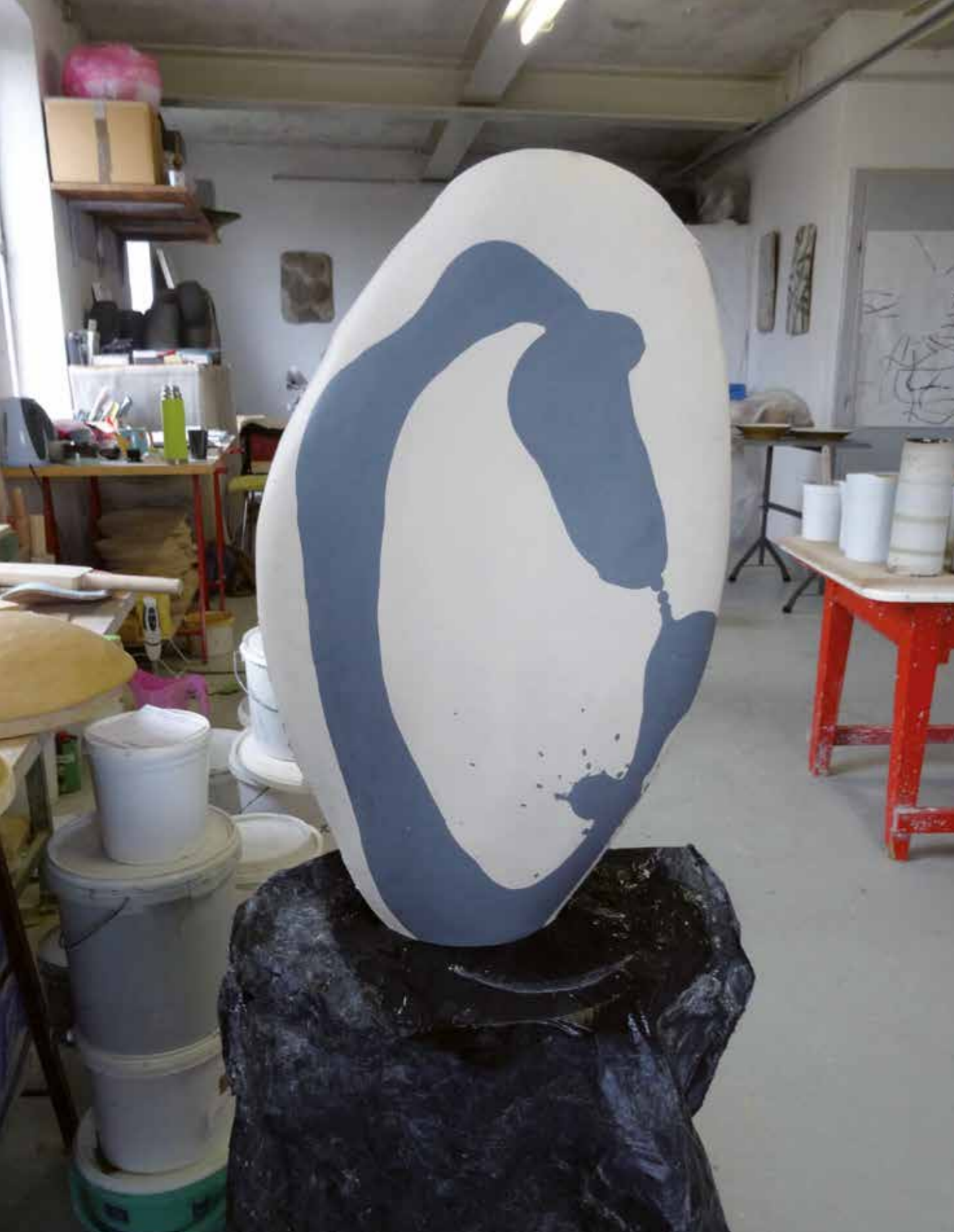
Opera finita prima della cottura. - Finished artwork.